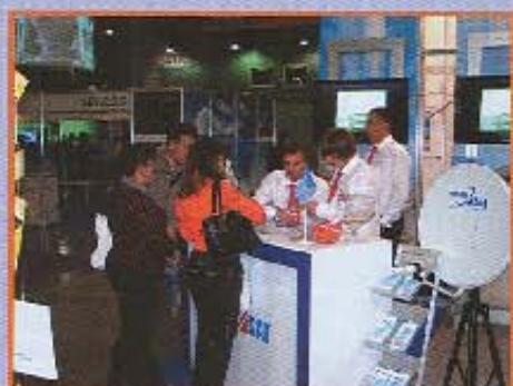
Стенд «Космос ТВ»