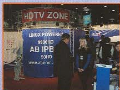
«Территория HDTV», ab-com Украина