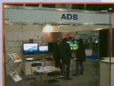
Стенд польской компании ADB