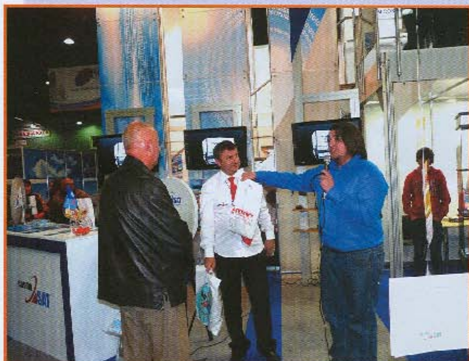
«Космос ТВ» раздает призы счастливицам