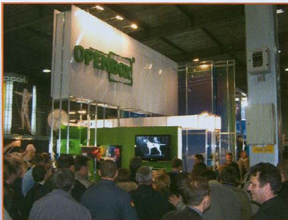
Стенд «Sat Systems»