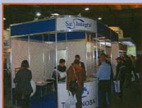
Стенд «Sat Integra»