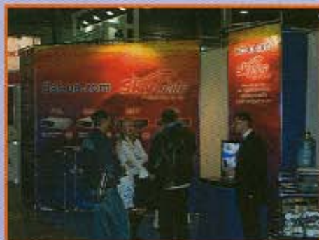
Стенд компании «Гефест»