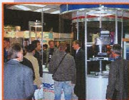
Стенд «Мортелеком Сервис»