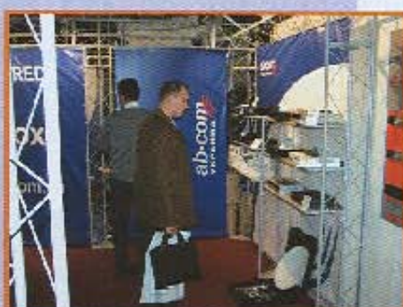
Стенд ab-com Украина