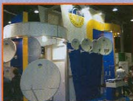
Фабрика «ООО Вариант»