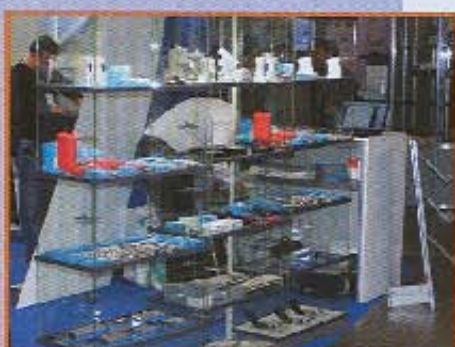
Оборудование ТМ "CosmoSAT"

Киев встретил участников и посетителей выставки хмурым туманным утром. Унылая погода не несколько не повлияла на работу выставочного мероприятия. Внутри помещения ребята шли толпой. На первый взгляд сразу было видно, что по сравнению с прошлым годом число участников заметно уменьшилось. Отсутствовали некоторые основные участники рынка продаж спутникового оборудования в Украине. Но даже при этом можно было увидеть достаточно четкую картину, что предлагается покупателям.